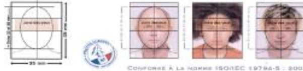
CONFORME À LA NORME ISO/IEC 19794-5 : 2005

LA PRISE DE VUE DOIT ÊTRE RÉCENTE ET RESSEMBLANTE AU JOUR DU DÉPÔT DE LA DEMANDE ET DE RETRAIT DU TITRE. LES PHOTOGRAPHIES DOIVENT ÊTRE RÉALISÉES PAR UN PROFESSIONNEL OU DANS UNE CABINE PHOTO, UTILISANT UN SYSTÈME AGRÉÉ PAR LE MINISTÈRE DE L'INTÉRIEUR.